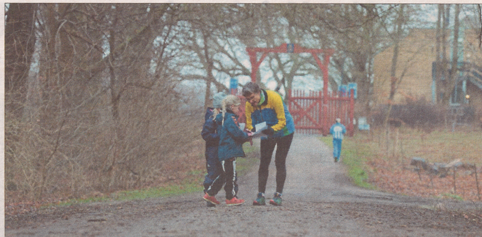
De første ti søndage i det nye år løber børn og voksne o-løb i de lokale skove.

"Når det foregår hen over alle de lyse timer, sikrer vi, at løberne bliver spredt i skoven. Vi opfordrer til, at man kun løber med personer inden for